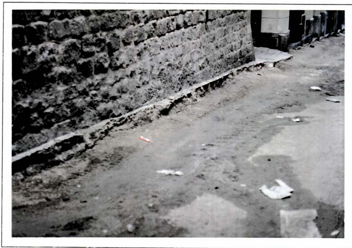
Vista parcial del carrer on s'observen els nivells rebaixats durant les obres.