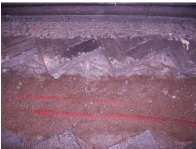
Foto 2. Obertura d'un tram de la rasa del carrer de la Canuda