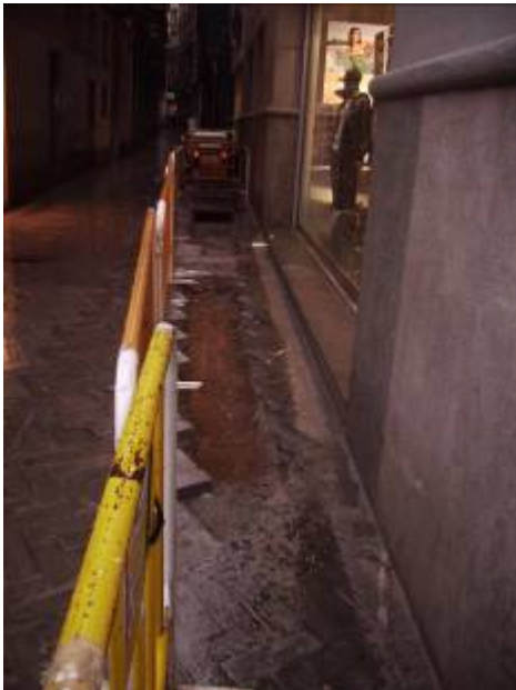
Foto 1. Obertura de la rasa carrer Bertrellans