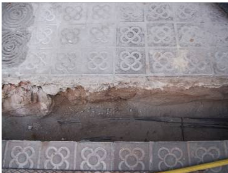
Foto 3. Seqüència estratigràfica de la rasa