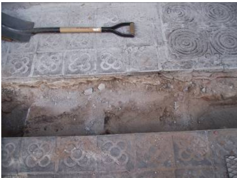
Foto 2. Tram de la rasa en procés de ser rebaixat