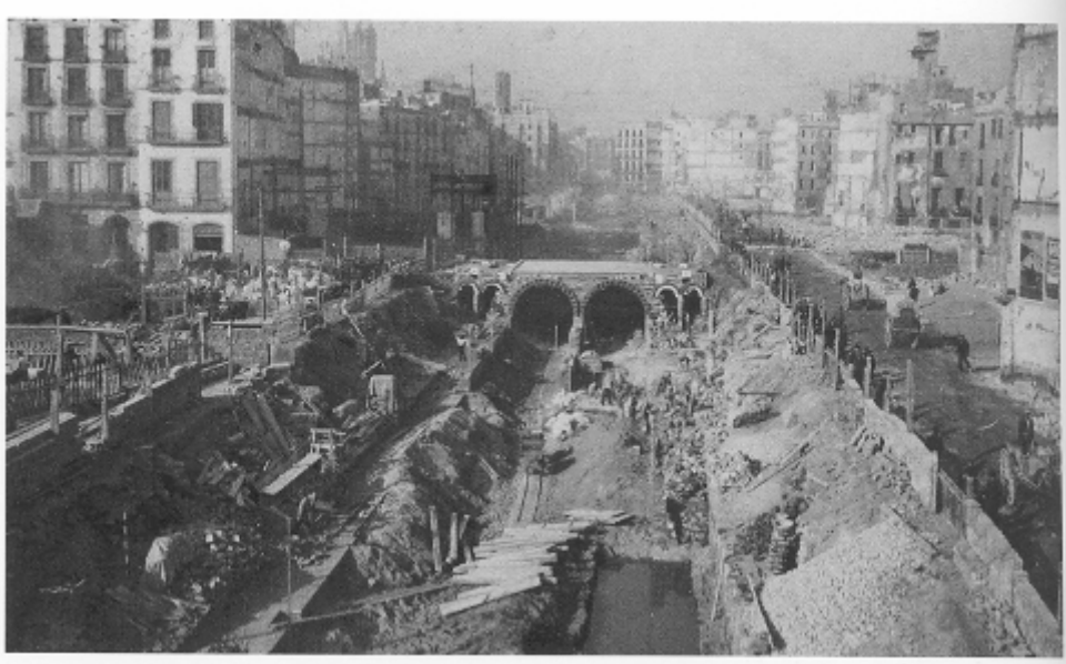
Túnels del futur metro, Via Laietana (Museu d'Història de Barcelona)

Igualment, la construcció de diferents edificis al voltant del Pla de Palau, com ara els Porxos d'en Xifré, van separar el barri del que havia estat la seva ancestral font de riquesa, el mar.