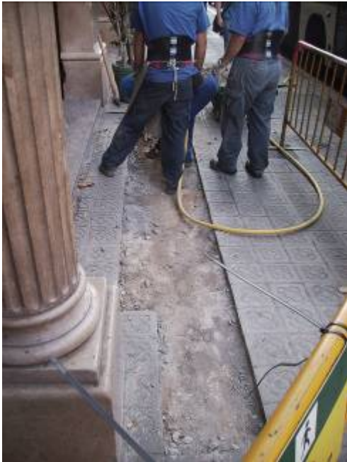
Foto 1. Obrers començant a rebaixar un tram de la rasa